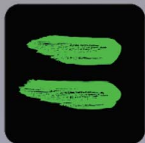
Athlete Central App

Du hast Probleme oder Fragen zu folgenden Themen?